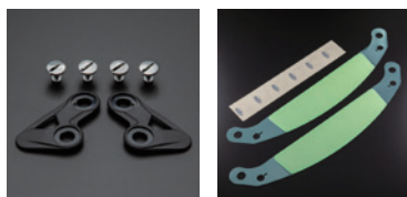
VR ネジセット | VR ティアオフシールド<クリアー>