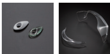
GP-6 ティアダクト<白>(クリアー) | VR PED