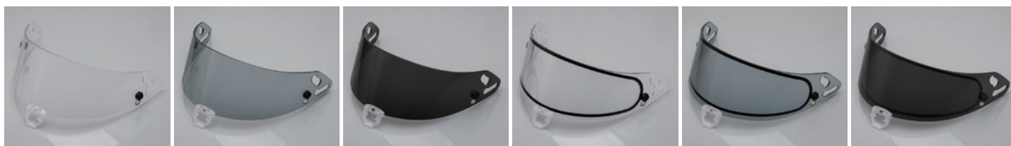
VR スタンダードシールド<クリアー> FIA 公認ラベル付 | VR スタンダードシールド<セミスモーク> FIA 公認ラベル付 | VR スタンダードシールド<スモーク> FIA 公認ラベル付 | VR ダブルレンズシールド<クリアー> FIA 公認ラベル付 | VR ダブルレンズシールド<セミスモーク> FIA 公認ラベル付 | VR ダブルレンズシールド<スモーク> FIA 公認ラベル付